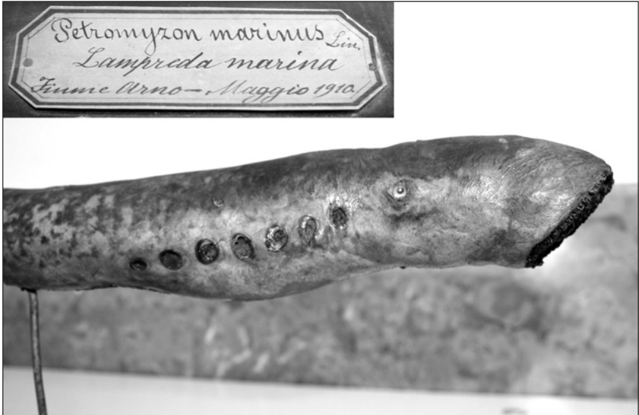
Fig. 3 – L'esemplare di lampreda di mare pescata nell'Arno, Petromyzon marinus Linnaeus, 1758, con particolare del cartellino.

Oltre alla raccolta di crani è da escludere che ci siano altri reperti in collezione che appartengano all'originaria collezione di Riccardo Folli e questo è verificabile da un raffronto tra le preparazioni e le cartellinature degli esemplari della collezione in esame con quelle della collezione ornitologica appartenuta proprio a Folli e attualmente conservata presso il Liceo Romagnosi di Parma (Roscelli & Calcagno, 2017).