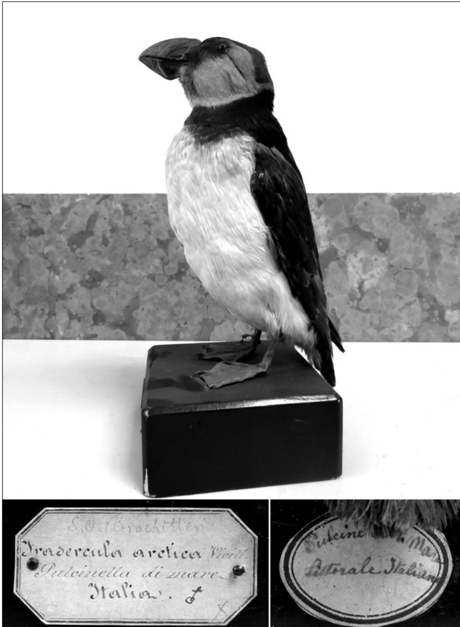
Fig. 4 – Pulcinella di mare, Fraterecula arctica Linnaeus, 1758, con particolare dei cartellini apposti sulla base lignea. Purtroppo la precisa località di cattura di questo esemplare è ignota.