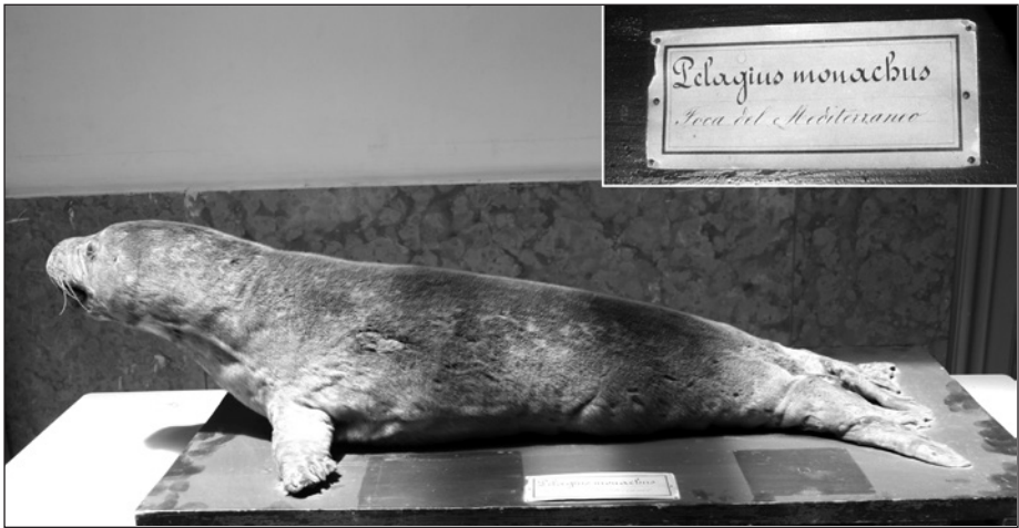
Fig. 5 – Giovane esemplare di foca monaca mediterranea, Monachus monachus Hermann, 1779, con particolare del cartellino. Questo è uno dei tre esemplari tassidermizzati presenti nelle collezioni napoletane.

Tra i mammiferi notevoli in collezione vanno segnalati due esemplari di lontra europea, Lutra lutra Linnaeus, 1758, in eccellente stato di conservazione ma di provenienza purtroppo sconosciuta, un giovane di foca monaca mediterranea, Monachus monachus Hermann, 1779 (Fig. 5), esemplare che si aggiunge ai due già presenti nelle collezioni napoletane (Maio & Picariello, 2000; Maio & Crovato, 2017), di cui purtroppo non si è trovato alcun dato che ne sveli la provenienza precisa, e una giovane vigogna, Vicugna vicugna Molina, 1782, proveniente da Cuzco (Perù) e donata all'istituto "Alla Querce" dal Sig. Ramon de Herrera nel 1904.