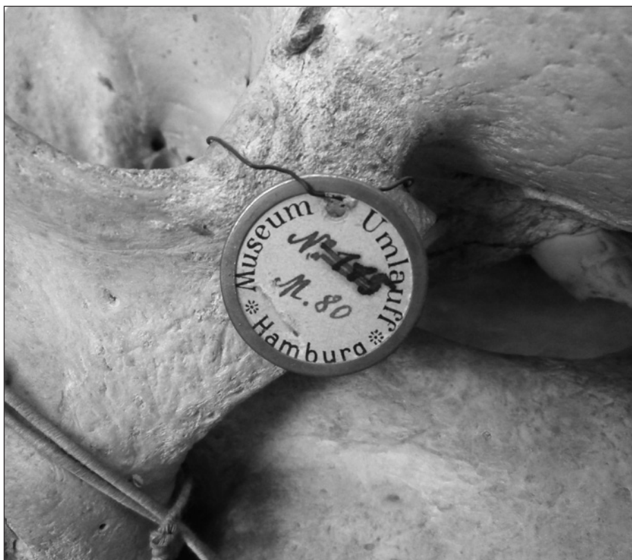
Fig. 1 – Cartellino originale di uno dei crani che Riccardo Folli acquisì dall’Umlauff Museum di Amburgo.

risultano appartenere ad uno sciacallo della gualdrappa, Lupulella mesomelas , e ad un lupo dorato africano, Canis anthus Cuvier 1820. Questi due crani testimoniano la varietà morfologica dei canidi presenti nel Corno d’Africa e la necessità di approfondire la diversità sistematica del genere Canis in Africa (Gippoliti & Lupi, 2020).