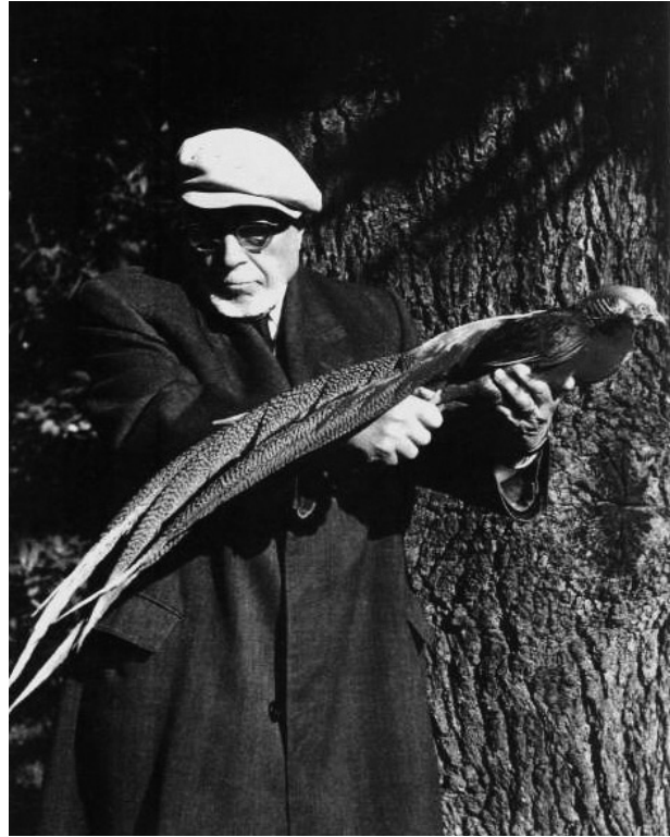
Ghigi con fagiano, Foto Archivio Fondazione Villa Ghigi.

Oltre che con la presidenza della Pro Montibus che comunque si conclude nel 1913, nel corso degli anni Dieci l'iniziativa protezionistica di Ghigi si identifica sostanzialmente con la vicenda dei parchi nazionali. La sovrapposizione delle carte faunistiche realizzate per la mostra di Vienna del 1910 mostra infatti l'importanza naturalistica dell'Alta Val di Sangro, in Abruzzo, come punto di massima